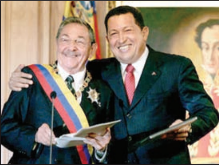
Hugo Chávez a ricibi Raúl Castro na Palacio Miraflores

E presidente Cubano Raúl Castro diasabra ultimo a gradici pa e apoyo di Venezuela, despues di yega e pais como parti di su prome gira internacional, pa cumpli cu un bishita oficial y firma dos memorandum di entendimiento den area petrolera y di informatica.